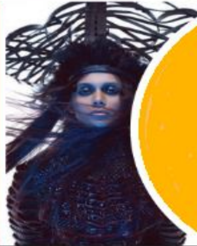
High end Fashion