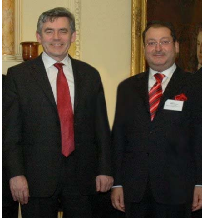
11. 11月20日(2008年) 在伊拉克首都巴格达举行的会议上。

2008年4月30日，伊拉克政府与联合国开发计划署（UNDP）在巴格达签署了为期五年的合作框架协议。该协议旨在加强伊拉克在基础设施、能源、农业和工业领域的可持续发展。UNDP将提供总计1.5亿美元的赠款，用于支持伊拉克政府的各项发展计划。协议还规定，UNDP将协助伊拉克政府提高公共服务的效率和质量，并促进私营部门的发展。此外，UNDP还将为伊拉克政府提供技术援助和咨询服务，帮助其制定和实施各项政策。该协议的签署标志着伊拉克与UNDP的合作进入了一个新的阶段，也将为伊拉克的经济社会发展做出重要贡献。